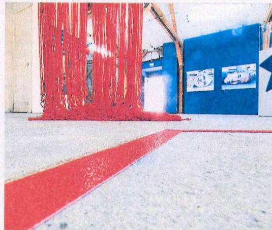
Der rote Faden auf dem Fußboden ist kein Kunstwerk, sondern der „Leitfaden“ einer Audioguide-App für Blinde und Sehgeschwache. Die roten Fäden dagegen gehören zur Installation „Fahne hoch“ von Frenzy Höhne.